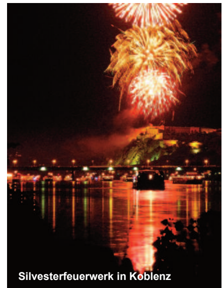
Silvesterfeuerwerk in Koblenz

Kurfürsten von Trier blühte Koblenz weiter auf und es entstand eine Vielzahl von kulturellen Schätzen in Form von Kirchen, Schlössern und Festungsanlagen. Aus der auf dem Ehrenbreitstein um 1020 erbauten Burg entstand nach und nach die Festung Ehrenbreitstein. Freuen Sie sich auf diese faszinierende Stadt mit ihrer 2000-jährigen Geschichte und bewundern Sie die Kirchen, Schlösser, ehemalige Adelshäuser und herrschaftliche Bürgerhäuser bei einer