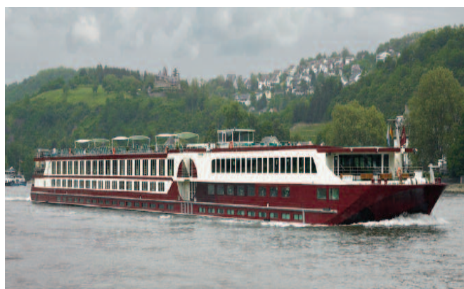
Ihr Schiff: MS Serenity

Zum Jahreswechsel laden wir Sie zum festlichen Gala-Dinner mit 5-Gang-Menü ein. Um Mitternacht erleben Sie dann am Zusammenfluss von Rhein und Mosel, am Deutschen Eck in Koblenz ein prächtiges Höhenfeuerwerk. Am Neujahrstag legt unser Schiff in Bonn an. Auf einer Stadtrundfahrt (fakultativ) erleben Sie die vielfältigen Facetten der Beethovenstadt. Unsere Reise klingt am 2. Januar in Köln aus.