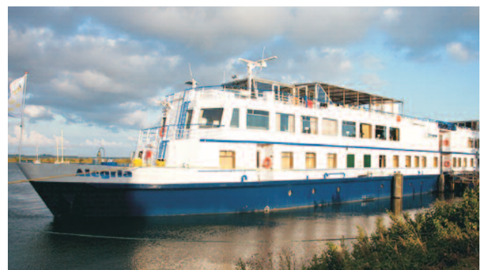
Ihr Schiff: MS Alegria

Nach dem frühen Ablegen von Bonn erreicht unser Schiff nach dem Mittagessen Koblenz, Ort der Bundesgartenschau 2011. Besuchen Sie mit uns die schöne Stadt mit ihrer 2000-jährigen Geschichte. Die Römer bauten hier erstmals eine städtische Siedlung. Unter der Herrschaft der Erzbischöfe und Kurfürsten von Trier blühte Koblenz auf und es entstand eine Vielzahl von kulturellen Schätzen in Form von Kirchen, Schlössern und Festungsanlagen. Unternehmen Sie mit uns einen Altstadtspaziergang mit Besichtigung der Liebfrauenkirche, der Florinskirche und der Basilika St. Kastor. Danach besuchen Sie das Deutsche Eck am Zusammenfluß von Rhein und Mosel. Wer möchte, kann anschließend mit der für die BUGA gebauten Panorama-seilbahn zur gegenüberliegenden Festung Ehrenbreitstein schweben und den phantastischen Blick über das Mittelrheintal genießen (fakultativ). Das Schiff bleibt über Nacht in Koblenz.