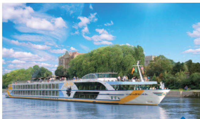
Ihr Schiff: MS VistaPrima

Frühmorgens erreicht unser Schiff Melk. Wir besuchen das berühmte Benediktinerkloster mit der barocken Stiftskirche, dem Marmorsaal und der berühmten Bibliothek. Als Wahrzeichen der Wachau gehört das Stift Melk zum UNESCO-Weltkulturerbe. Gegen Mittag geht die Fahrt weiter durch die herrliche Wachau, vorbei an Dürnstein und Krems. Am Abend Ankunft in Wien. Gelegenheit zu einer Rundfahrt durch die beleuchtete Stadt (fakultativ).