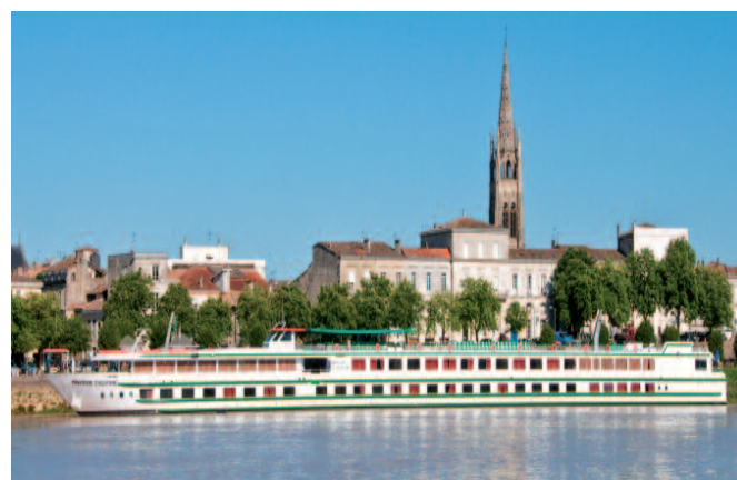
Ihr Schiff: Princesse d'Aquitaine

Am Vormittag gemütliche Fahrt auf der Gironde bis zur Mündung in den Atlantik und wieder aufwärts nach Blaye, das auf